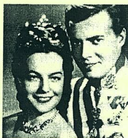
Aufnahme aus dem im Hause gedrehten SISSY-Film von 1956 mit Romy Schneider und Karl-Heinz Böhm